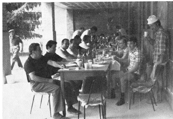
La merenda conclusiva degli amici e sostenitori della Pro Loco... tutti i salumi finiscono in gloria...