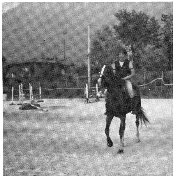
Prova del percorso del concorso ippico.