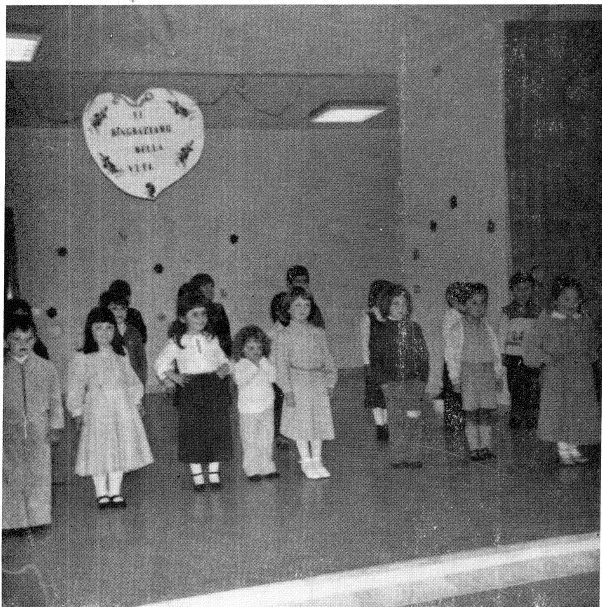
Un momento di allegria alla festa della mamma.

La scuola materna prosegue abbastanza bene. In questo mese si nota un po' di carenza a causa dell'epidemia influenzale, che però passa presto. I bimbi trascorrono la loro giornata con gioiosa serenità composta di canti, giochi, preghiere, disegni, poesie, ecc. Ora hanno preparato il lavoretto per la festa dell'Immacolata, poi attendono Santa Lucia e finalmente Gesù Bambino. Il S. Natale è sempre tanto caro ai bimbi per la loro semplicità e innocenza.