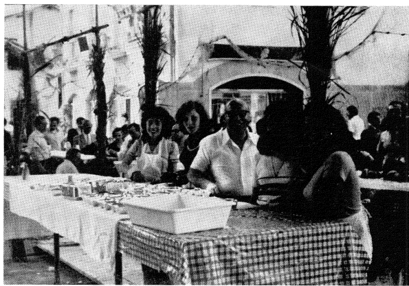
Un primo piano delle nuove collaboratrici impegnate nella distribuzione delle alborelle.

Speriamo, che il lavoro, che da diversi anni, è svolto con giovanile entusiasmo, sia gradito come sempre, da locali e villeggianti, e si ringrazia anticipatamente quanti, sostenitori e soci, sempre in aumento, ci incoraggiano.